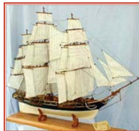
Le HMS Confiance, construit au chantier naval de l'île aux Noix en 1814, était doté de 37 canons.

Le chantier naval entraîna une activité intense sur l'île aux Noix. La garnison fut considérablement augmentée pour en assurer la protection. Un grand nombre d'ouvriers y résidaient avec leurs familles. Pour bien mesurer l'importance du chantier, mentionnons que le constructeur de navires John Goudie, de Québec, procéda en 1815 à l'embauche de 283 ouvriers de la région de Québec, pour les envoyer travailler sur les chan-