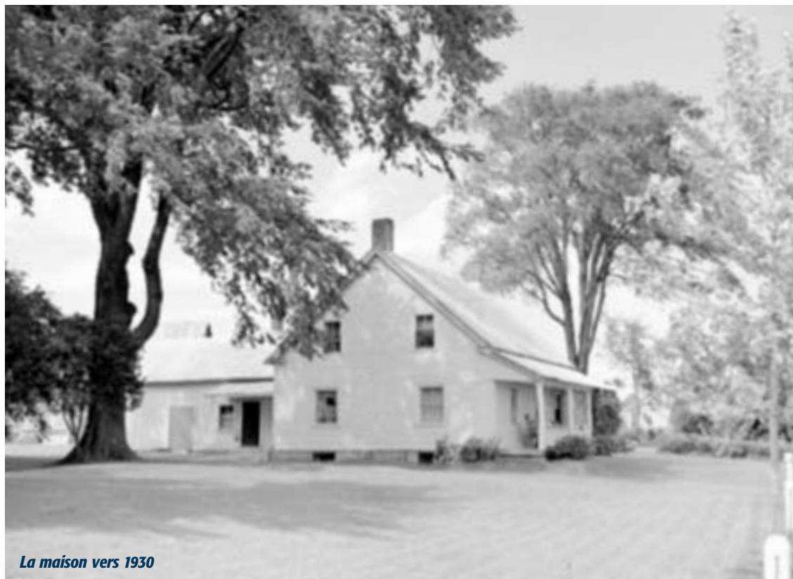
La maison vers 1930